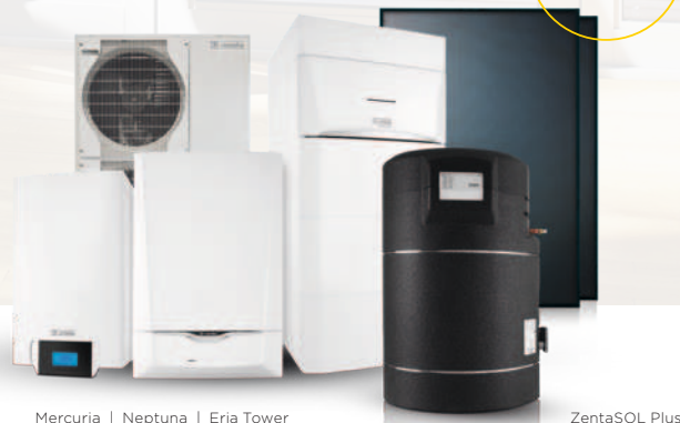
Mercuria | Neptuna | Eria Tower