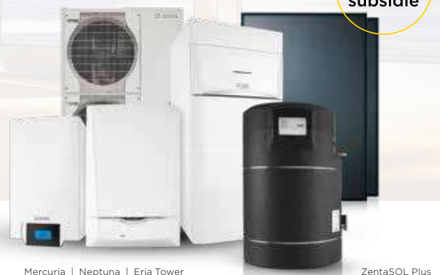
Mercuria | Neptuna | Eria Tower